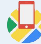
Maps SDK für iOS