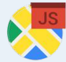
Maps JavaScript API