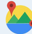
Distance Matrix API