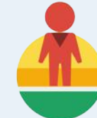
Street View API