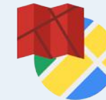
Static Maps API