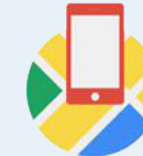
Maps SDK für iOS