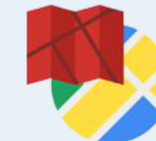
Static Maps API