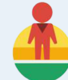
Street View API