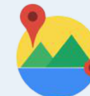
Distance Matrix API